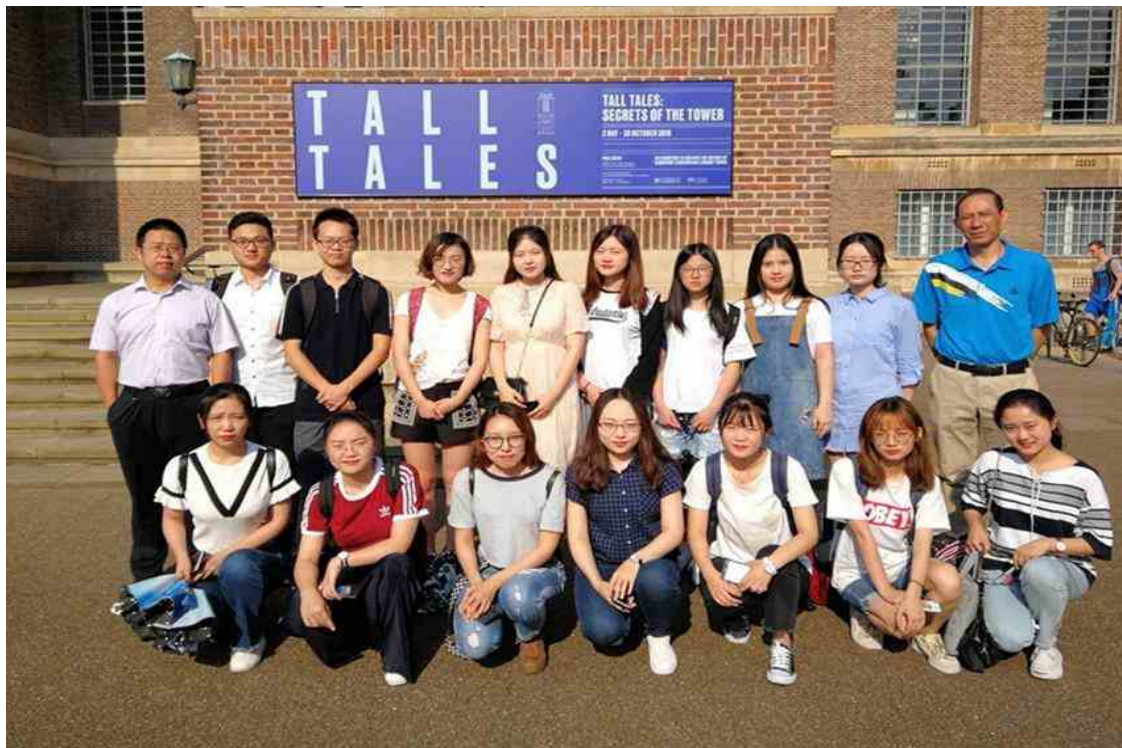
图 1 访学团队在剑桥大学图书馆前合影

访学途中，团队先后参访了剑桥大学国王学院、剑桥科学园、三一学院、李约瑟研究所和剑桥大学图书馆等机构，深入了解剑桥大学作为世界一流大学在科学研究、人才培养和社会服务等方面的成功经验。