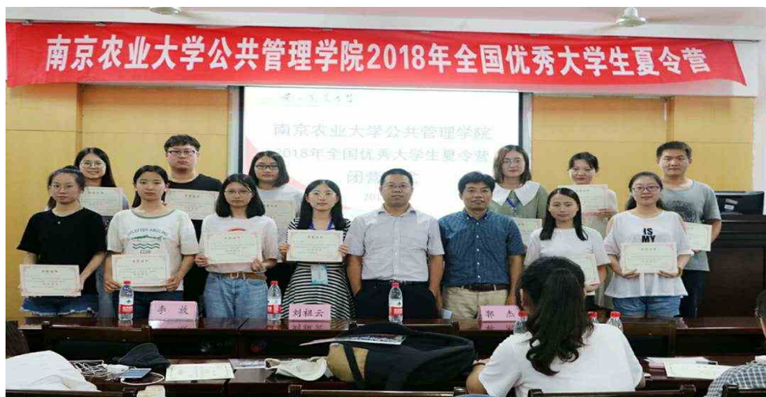
图4 夏令营闭幕颁发证书

在论文汇报和研究设计中，营员们通过个人汇报和讨论等环节与老师们面对面交流，老师对营员们的汇报进行了详细的点评，并完成打分选拔工作。此次夏令营共选拔出优秀营员 33 名，其中行政管理专业 6 人，社会保障专业 4 人，土