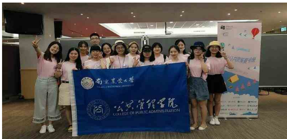
图 2 访学团队合影

经过选拔及前期准备，我院土地资源管理、人力资源管理等专业 13 名本科生入选，在本科生辅导员武昕宇老师的带领下，于 2018 年 7 月 21 日至 27 日赴香港参加夏令营活动。