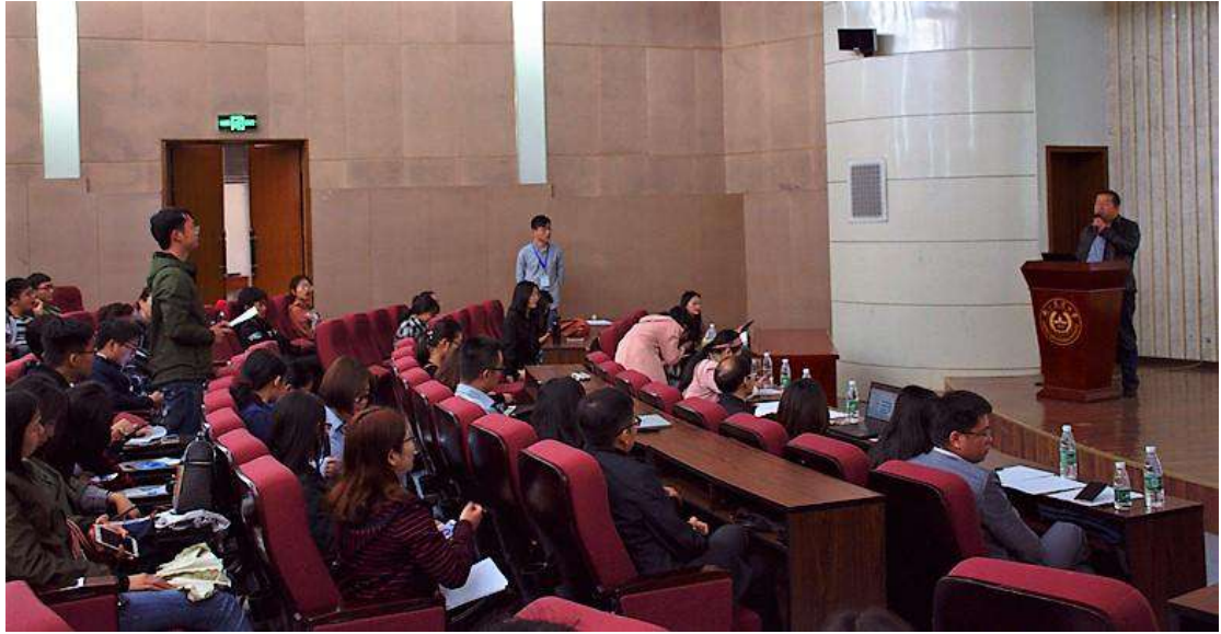
图 13 用人单位招聘宣讲会现场