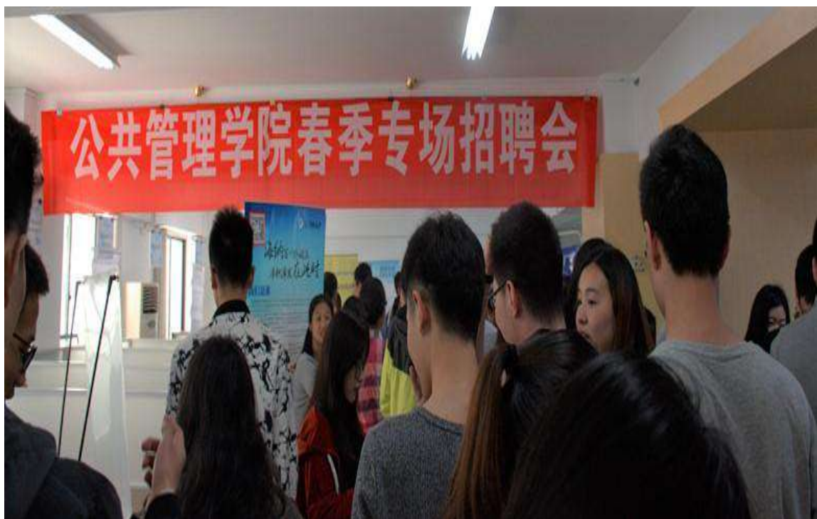
图 12 公共管理学院春季专场招聘会现场

本次招聘会的圆满举办，不仅为应届毕业生提供最新的就业资讯，也给予了我院学子参与社会实践的机会；同时也有利于企业更好地了解高校人才的状况，有针对性地开展人力资源工作，从而达到学生实现自身价值和发展的双赢。