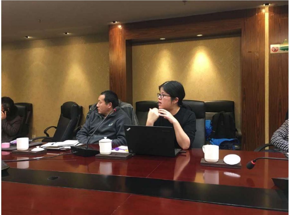
图 8 乡村振兴、生态文明与土地管理科学创新研讨会现场