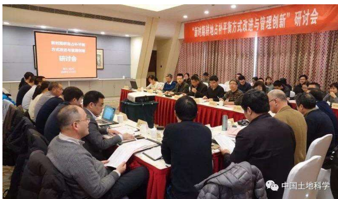
图9 新时代耕地占补平衡方式改进与管理创新研讨会现场

通过本次研讨会的召开，各位与会专家通过思想碰撞，互相交流观点，力争在今后的工作中结合国家政策和地方实践，不断探索新时代耕地占补平衡管理方式转变的理论、方法和技术体系，促进国家政策更好地落实、更科学地指导实践。