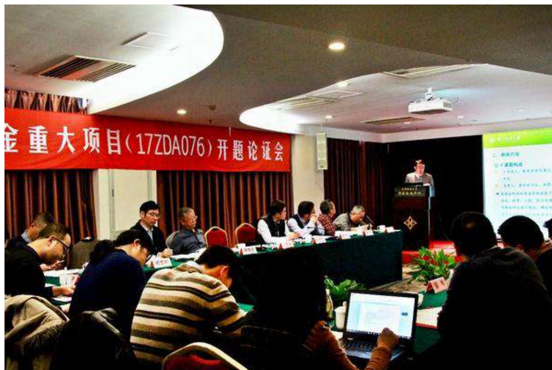
图 1 国家社会科学基金重大项目（17ZDA076）开题论证会（1）

出席会议。会议由南京农业大学人文社科处处长黄水清教授主持，南京农业大学公共管理学院党委书记郭忠兴教授、南京农业大学人文社科处副处长卢勇教授，项目首席专家吴群教授及子课题组负责人、课题组成员等 60 余人与会。