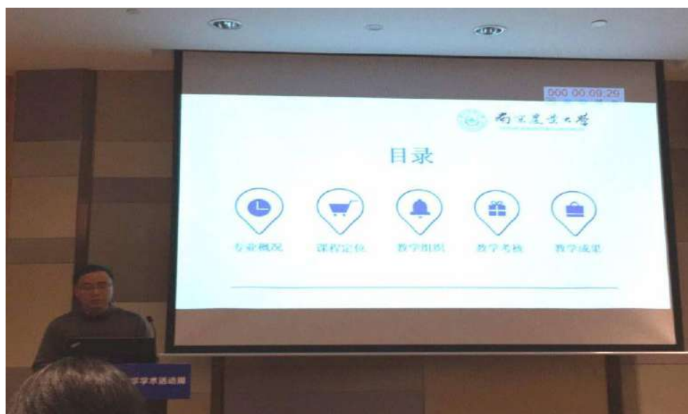
图 5 诸培新教授代表土地资源管理品牌专业说课

在专业建设与人才培养方面的交流，持续提高了我院品牌专业建设水平和人才培养质量。诸培新教授以《土地经济学》进行说课，从专业概况、课程定位、教学组织、教学考核及教学成果五个方面系统介绍了课程的建设情况，并与高校同仁们探讨与交流专业核心课程建设的经验，展示了我院教师潜心育人、精益求精的精神风貌。