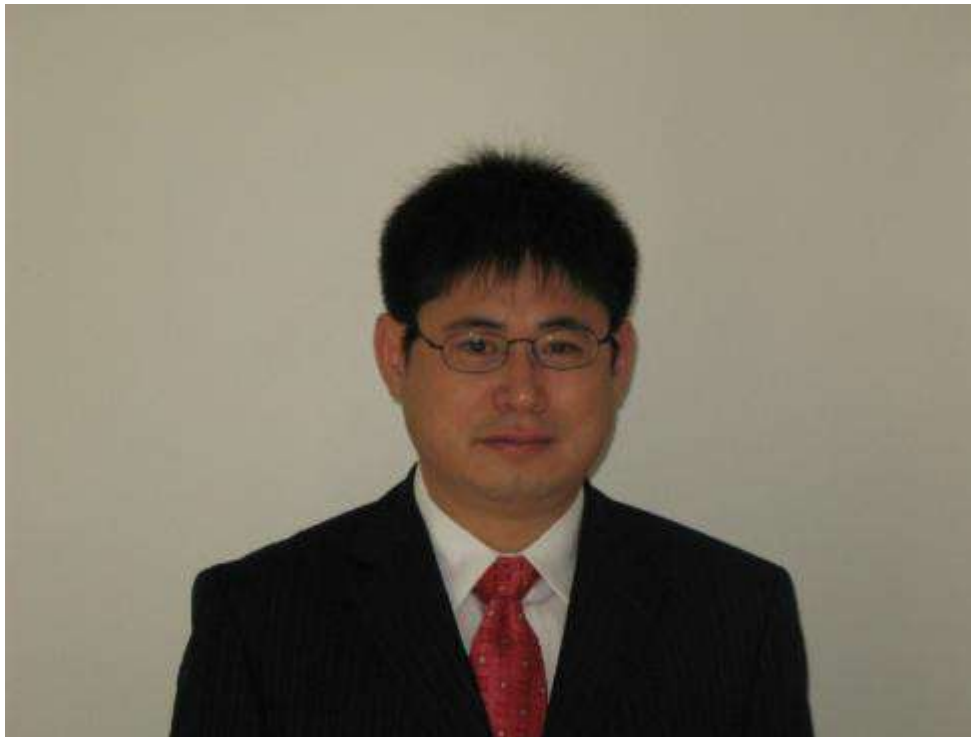
图 11 马里兰大学城市研究和规划系教授丁成日

此次丁成日教授受邀来到我院为土地资源管理专业博士生和高年级的硕士生系统地讲授城市经济学理论及最前沿的实证研究，使学生对城市经济学理论和实证研究有初步了解和认识。《高级城市经济学》这门课旨在让学生了解和掌握城市的一般均衡模型理论，城市体系一般均衡模型（新经济地理），有关城市交通、土地价格、城市增长边界等理论模型；了解基于城市经济理论的实证研究；并试图从理论和实证两方面回答城市为什么产生和发展，城市增长理论和依据，城市空间发展、市场和政策之间的相互关系和影响等。